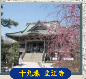
十九番 立江寺 小松島市の町中、四国88力所霊場の内に四力所ある「関所寺」の一つ。美しい姿の多宝塔、素晴らしい天井画と、「立江のお地藏さん」で親しまれている。