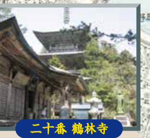
二十番 鶴林寺 杉の木の立ち並ぶ参道を進むと仁王像の山門。境内には樹齢千年を越える老木が生い茂り華やかな趣。本堂前に伝説の鶴の像が向かい合っています。