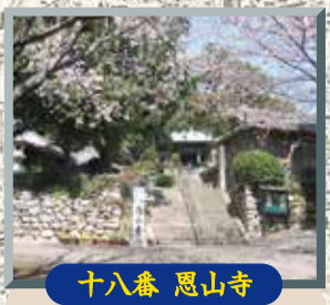
十八番 恩山寺 小松島市郊外、寺の裏山一帯は恩山寺自然公園で、展望台からの風景は素晴らしい。境内には多くの桜が植えられ、花見時には参詣の花見客で賑わう。