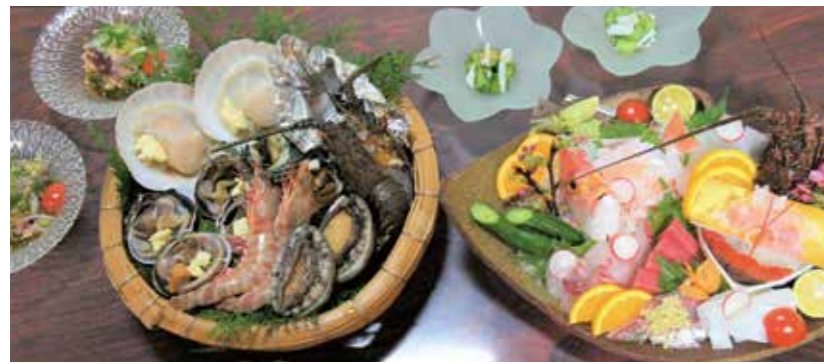
▲海賊料理 是盛產海鮮的德島才能享用到的燒烤類料理。將新鮮海鮮豪邁地烤過後味道更佳。