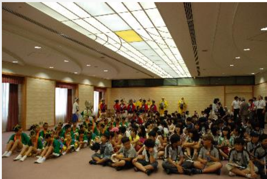
緊張又充滿期待的初次見面…