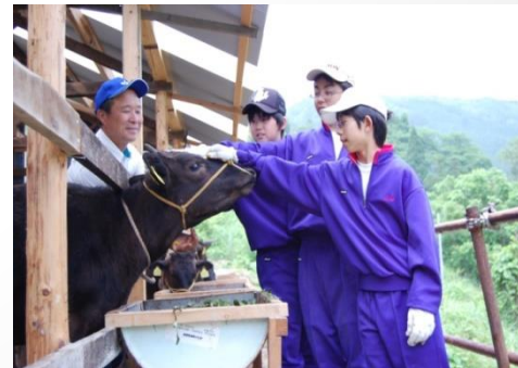
【牛的飼養體驗】 享受與動物相處的溫馨時光・・・