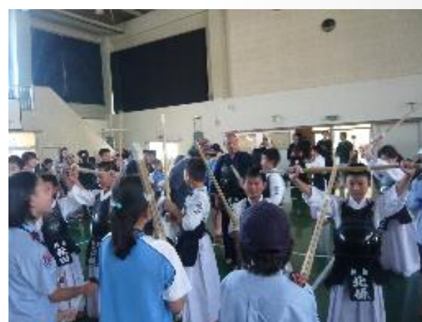
揮動竹刀，體驗劍道