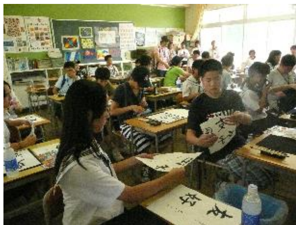
體驗日本文化（書道）