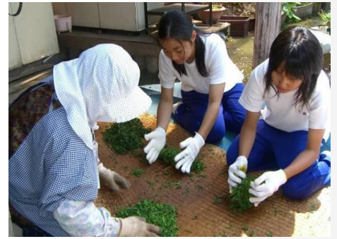
【製作祖谷番茶】 沏茶給家裏人喝！