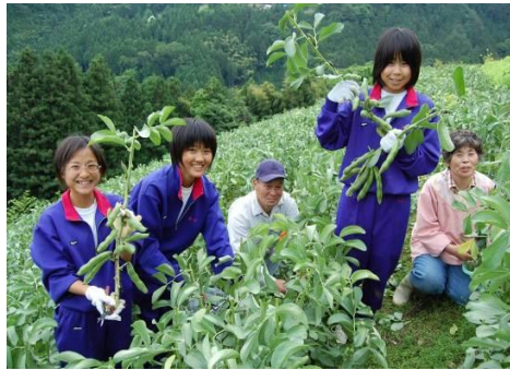
【蠶豆收成體驗】 幫忙出貨到產地直銷市場！！

半天或者1天時間體驗幫忙幹農活。體驗內容因每戶農家和季節而異。農家會把教育旅行和修學旅行的同學們當作家裏人對待。