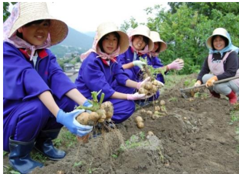
【土豆收成體驗】 拿來做今晚晚餐的炸土豆肉餅！！