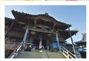
四国八十八ヶ所霊場 第19番札所 立江寺