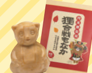
たぬき最中 (山陽堂)