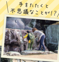
手をたたくと 不思議なことか!?

小松島ステーションパーク内の広場には、『高さ5m・胴回り5m・重さ5t』の巨大なたぬきの銅像が! その大きさは世界最大級!? 市民の憩いのときをゆったりと見守っている。