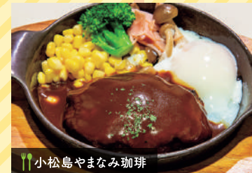
小松島やまなみ珈琲