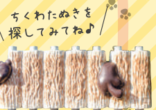
ちくわたぬきを 探してみよう!