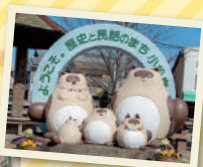
ファミリーたぬきが お出迎え!

〒徳島県小松島市南小松島町7-43 ☎ 0885-32-1537 (小松島市観光ボランティアガイド協会)