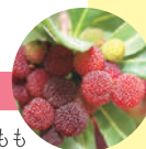
やまももシロップ

小松島は日本有数のやまももの生産地。収穫時期が6月中旬頃から6月下旬頃と2週間程しかなく、あまり市場に出回らないため“幻の果実”と言われる。その鮮やかな赤や甘酸っぱさを生かした果実シロップやジュレなどの加工品は見た目にも美しく、贈りものに最適。