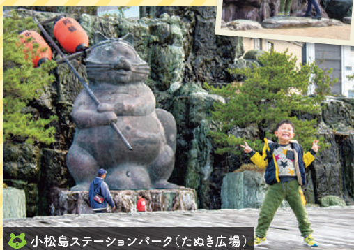
小松島ステーションパーク(たぬき広場)

小松島ステーションパーク内の広場には、『高さ5m・胴回り5m・重さ5t』の巨大なたぬきの銅像が! その大きさは世界最大級!? 市民の憩いのときをゆったりと見守っている。