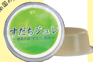
南国の太陽に育まれた味