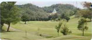
4 御所カントリークラブ