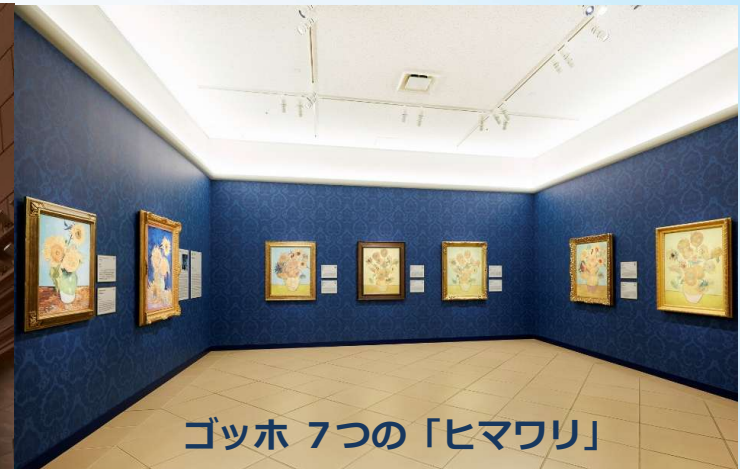
ゴッホ 7つの「ヒマワリ」

1,000点を超える西洋名画を陶板で原寸大に再現。 日本にいながら世界の美術館が体験できます。 開館: 9時30分~17時(入館券の販売は16時迄) 休館日: 月曜(祝日の場合は翌日)、1月は連続休館あり、その他特別休館あり、8月は無休 料金: 一般3,300円、大学生2,200円、 小中高生550円 ☎088-687-3737 ※写真は、大塚国際美術館の展示作品を撮影したものです