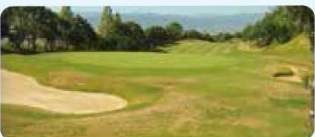
5 眉山カントリークラブ