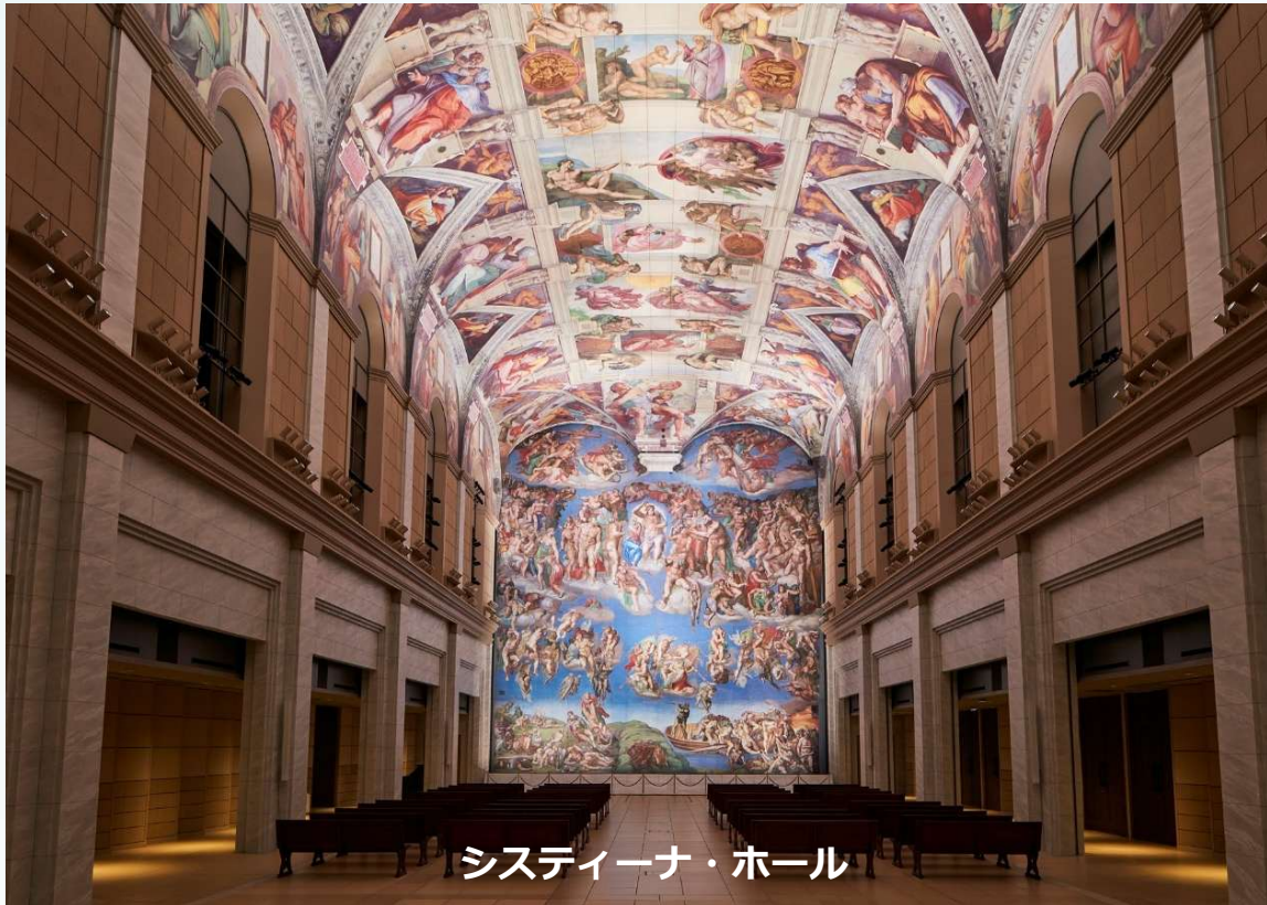
システィーナ・ホール