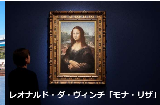
レオナルド・ダ・ヴィンチ「モナ・リザ」