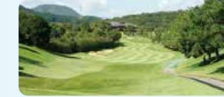
10 レオマ高原ゴルフ倶楽部