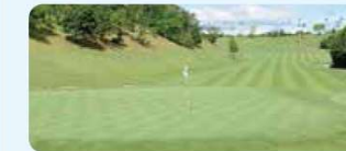
9 タカガワ東徳島ゴルフ倶楽部