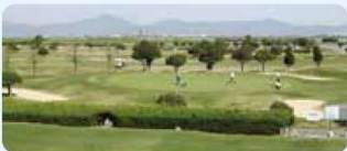
2 鳴門カントリークラブ