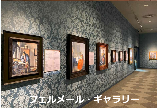
フェルメール・ギャラリー

1,000点を超える西洋名画を陶板で原寸大に再現。 日本にいながら世界の美術館が体験できます。 開館: 9時30分~17時(入館券の販売は16時迄) 休館日: 月曜(祝日の場合は翌日)、1月は連続休館あり、その他特別休館あり、8月は無休 料金: 一般3,300円、大学生2,200円、 小中高生550円 ☎088-687-3737 ※写真は、大塚国際美術館の展示作品を撮影したものです