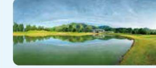
11 Jクラシックゴルフクラブ