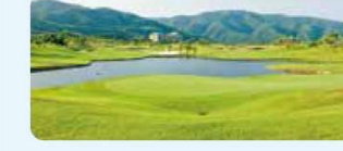
12 グランディ鳴門ゴルフクラブ36