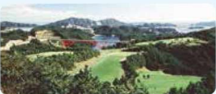
3 徳島カントリー倶楽部