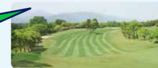
8 阿南カントリークラブ