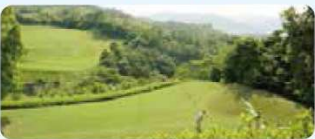
6 四国カントリークラブ